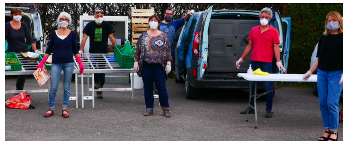
Les producteurs des Bios du coin se sont organisés pour fonctionner sous forme de drive.

Carole TONIN carole.tonin@biograndest.org