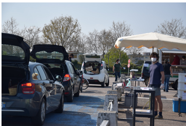
Producteurs et consommateurs du marché de Vandœuvre ont mis en place de nouvelles habitudes via la mise en place d'un drive.