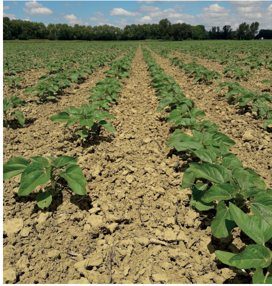
Terres Inovia - M. Abella